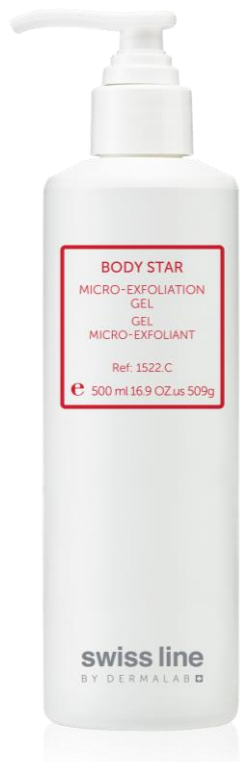
GEL MICRO-EXFOLIANT REF: 251522 Volume: 500 ml Net Price: $97.00