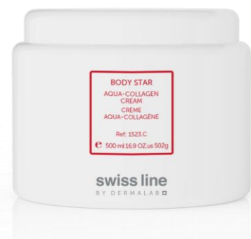
CREME AQUA-COLLAGÈNE REF: 251523 Volume: 500 ml Net Price: $193.00