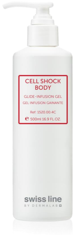
CELL SHOCK CORPS GEL INFUSION GAINANTE REF: 251520 Volume: 500 ml Net Price: $118.00

SHAPING & LIFTING COMPLEX est à appliquer après l'utilisation de l'appareil en léger massage suivant les mouvements de drainage lymphatique.