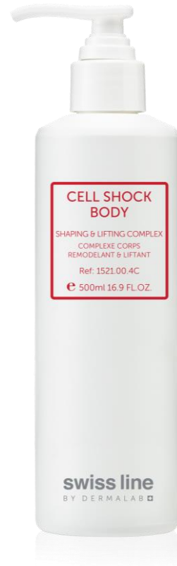
CELL SHOCK CORPS COMPLEXE REMODELANT LIFTANT REF: 251521 Volume: 500 ml Net Price: $134.00