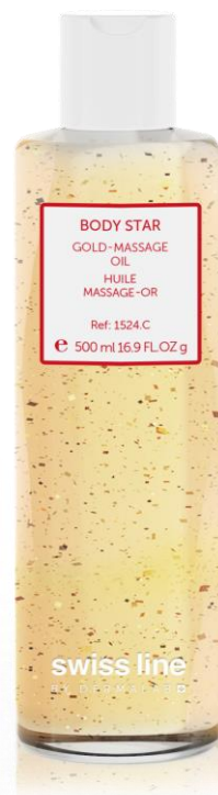
HUILE DE MASSAGE OR REF: 251524 Volume: 500 ml Net Price: $159.00